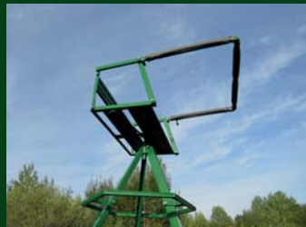
ROZHLED A POHODLÍ